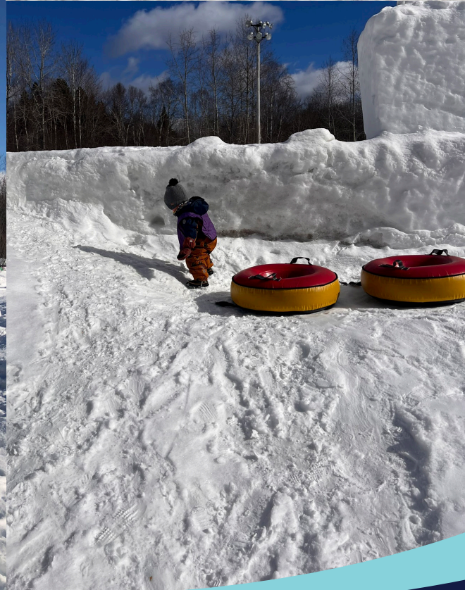
Semaine de relâche au parc Henri-Piette