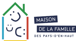
Maison de la famille