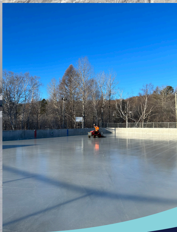
L'hiver à Sainte-Anne-des-Lacs : sentiers, patinoires, glissade, château de neige et jeux pour la famille !