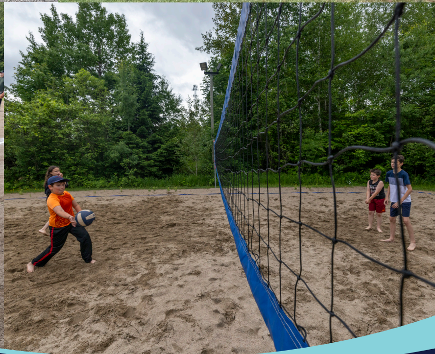
Volley-ball, balle-molle, pétanque, mini-soccer, camp de jour Magicoparc et Fête nationale