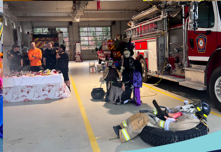
Halloween dans le noyau villageois Paysage d'automne : merci à Sylvie Villemare pour sa photo du lac Johanne !