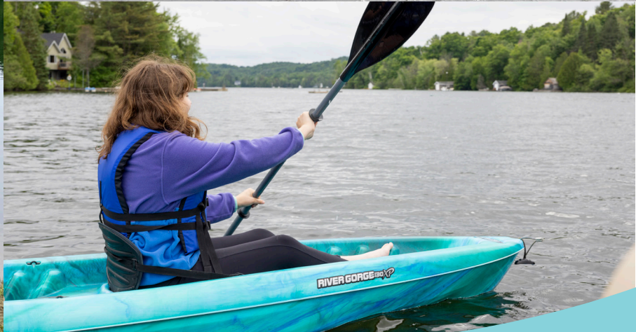
Baignade au lac Loiselle et location d'embarcations au parc Irénée-Benoit